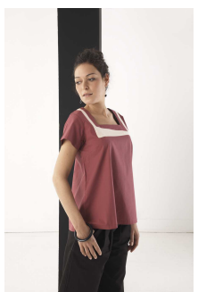
Un été en automne