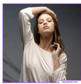
Sur le dos des filles